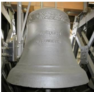
Die Inschrift lautet: „Kommt lasst uns anbeten“, Ton: Es, Durchmesser: 62 cm, Gewicht: 220 kg