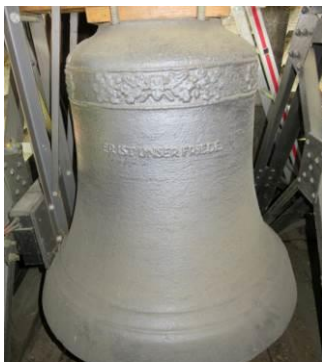
Die Inschrift lautet: „Er ist unser Friede“, Ton: C, Durchmesser: 95 cm, Gewicht: 300 kg

Worte sind dies, mit denen der Dichter Friedrich Schiller in seinem „Lied von der Glocke“ auf seine poetische Weise andeutet, zu welchen Anlässen das Geläut unseren kirchlichen All- und Feiertag zu begleiten pflegt. Bei Taufen und Trauungen, bei Gottesdiensten, Fürbitten, Beerdigungen, auch bei allgemeinen Notständen. An allen Werktagen wird um 18:00 Uhr der Feierabend verkündet und an jedem 1. Januar um 0:00 Uhr der Beginn des neuen Jahres. Das „Totenläuten“ in den Morgenstunden wurde schon im vorigen Gemeindebrief erwähnt. Uralte Regeln, die noch immer ihre Gültigkeit haben und uns daran erinnern, dass unsere Zeit in Gottes Händen steht.